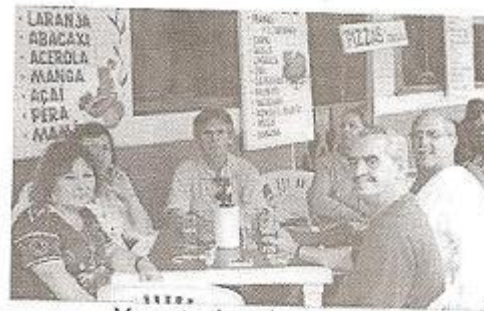
Momentos de total descontração