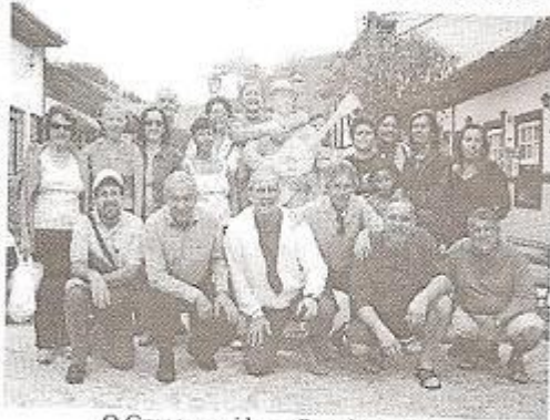
O Grupo reunido na Rua dos Poetas

Por mais que me esforce, não consigo descrever com fidelidade o que se sente ao estar naquela Cidade. O Clima é ameno, o Astral é o que se pode desejar de melhor. As energias positivas que lá existem, envolvem a todos. As emoções ficam à flor da pele. O Romantismo toma conta de todos. As serestas, o hospitalidade, a comida caseira... Enfim, tudo é muito envolvente.