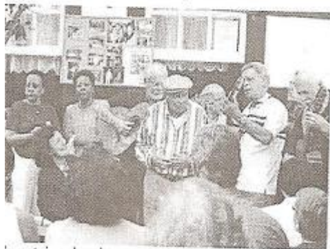
Interesseiros locais, com a participação de visitantes

O sucesso do evento foi tão grande, tão bem aceito, que visitas a Cidade de Conservatória farão durante algum tempo, parte do roteiro anual de passeios a serem realizados pela ASAN.