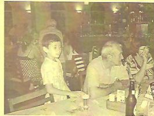
Mais fotos do Encontro poderão ser vistas nos escritórios da ASAN